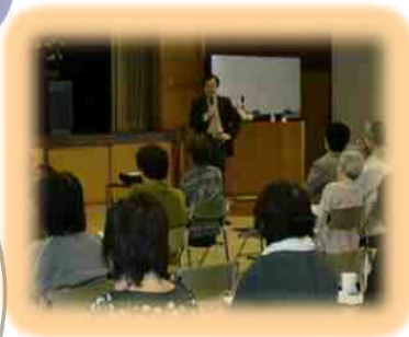
平成23年11月 開催した パーキンソン病 講演会の様子。