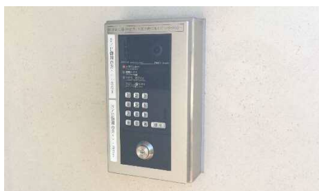
上：入口通路 中：郵便受け 下：オートロック