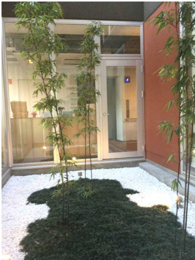
エントランス中庭

ありがちな高齢者施設の佇まいでなく、来客を招きたくなるような住まいを意識し意匠にこだわっております。